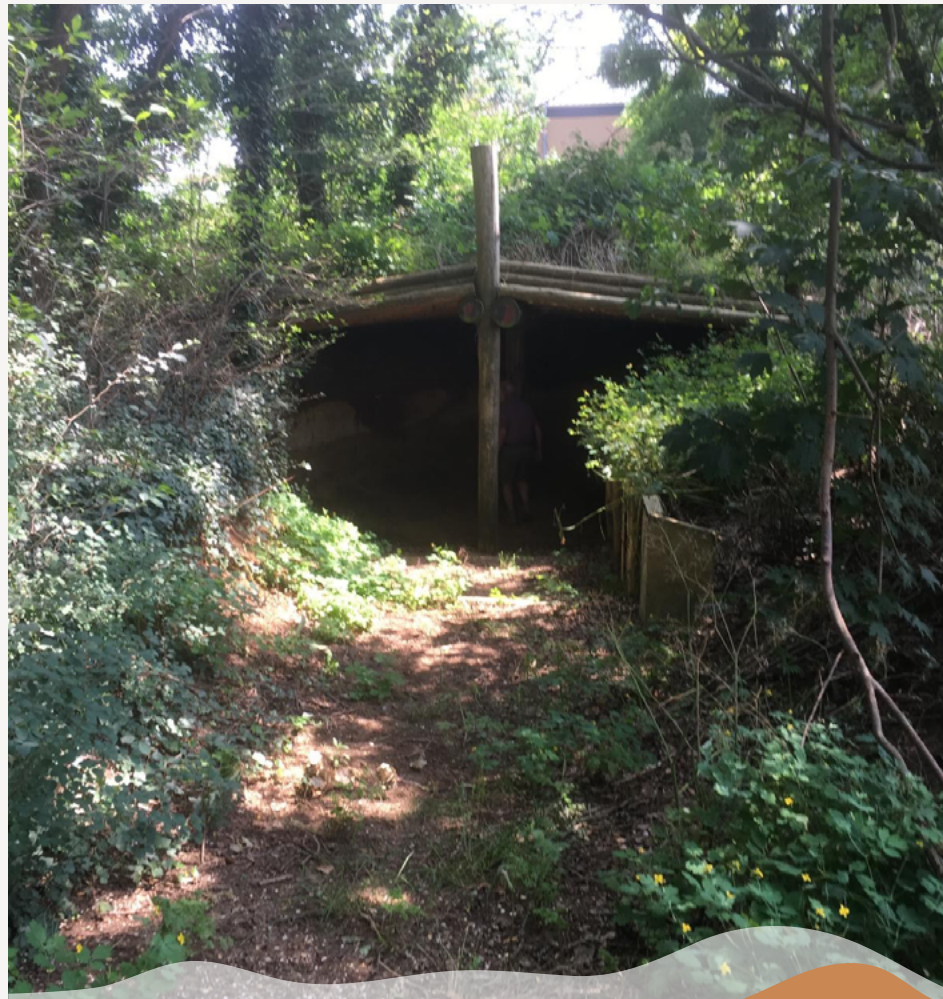
De groeve is voor veel mensen uit de regio nog een verborgen parel.

Het gebied van de Schelde Delta is 5.500 km 2 groot, omvat 61 gemeenten en telt 1.500.000 inwoners. Zee en rivieren hebben in de loop van de tijd hun sporen achtergelaten in de ondergrond. De diverse lopen van de Schelde zijn tekenend voor het landschap. En dan zijn er nog de vele karakteristieke elementen: verdronken dorpen, middeleeuwse bolle akkers, veenwinning, forten, vestingen, linies... Elke plek vertelt zijn eigen verhaal en draagt zo bij aan de identiteit van het mondingsgebied van de Schelde. In het toekomstige Geopark Schelde Delta maken we samen dit verhaal zichtbaar.