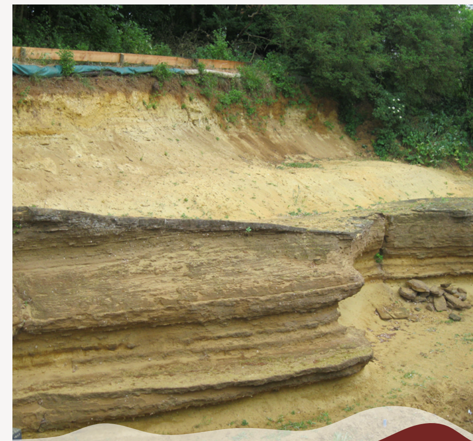
De groeve heeft te lijden onder wind, water en vorst. Jaarlijks verdwijnt er een stukje van de grondlagen.

Ben of voel jij je betrokken bij Grenspark Groot Saeftinghe? Je kunt een account aanmaken op het participatieplatform en zelf meedenken- en praten over het grenspark: www.grenspark-groot-saeftinghe.eu